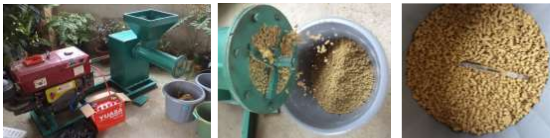
Gambar 2. Pengujian Kinerja Mesin (Kiri dan Tengah), Granular yang Dihasilkan (Kanan).