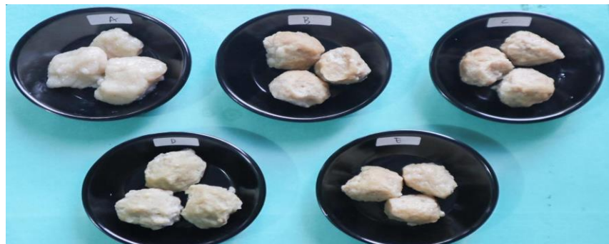
Gambar 2. Bakso Tetelan Merah Tuna dengan Ekstrak Bahan Alami.

Warna menjadi bagian penting dalam penilaian uji hedonik hal ini didasarin karena atribut yang dapat dinilai langsung oleh panelis dari mata. Gambar 1 menunjukkan warna pada bakso TMT dengan penambahan umbi bit diperoleh rata-rata 4,5 (Sangat suka) pada tingkat kesukaan tertinggi sedangkan warna bakso TMT tanpa penambahan ekstrak memiliki nilai rata rata 3,67 (suka) pada tingkat kesukaan terendah. Setiap bakso memiliki warna yang berbeda-beda hal tersebut dibuktikan karena pigmen yang terkandung dari tanaman. Pada umumnya golongan utama pigmen tumbuhan adalah klorofil, karatenoid, flavonoid, dan kuinon. Pigmen yang berasal dari wortel yaitu karoten yang berwarna oranye, ubi ungu dan bunga telang yaitu antosianin pemberi warna ungu sampai kebiruan, dan umbi bit memiliki pigmen betasianin pemberi warna merah. Pada penelitian ini pigmen betasianin penghasil warna merah yang membuat tujuan panelis memberikan nilai tertinggi karena warna yang dihasilkan pada bakso sedikit kemerahan dibandingkan bakso yang ditambahkan ubi ungu, bunga telang, wortel atau tanpa penambahan ekstrak memiliki warna bakso yang hampir sama yaitu sedikit kegelapan. Penampakan visual bakso tetelan merah tuna dengan ekstrak bahan alami disajikan pada Gambar 2.