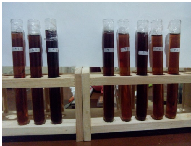
Gambar 3. Minuman Kahwa Daun dengan Variasi Proses Pembuatan

Proses pembuatan minuman kahwa daun yang kedua (penyeduhan) hanya ditemukan di daerah Malalo, Kabupaten Tanah Datar. Daun kopi diseduh yang disebut perian/bamboo dan tutup perian terbuat dari ijuk. Cara penyeduhan ini telah diadopsi dalam penyeduhan kahwa daun kemasan celup dan produk instan berbasis kahwa daun. Dengan proses penyeduhan, kahwa daun yang dihasilkan memiliki warna air seduhan lebih terang daripada air seduhan kahwa daun yang dibuat dengan pemasakan. Minuman kahwa daun yang dihasilkan seperti teh (Gambar 3).