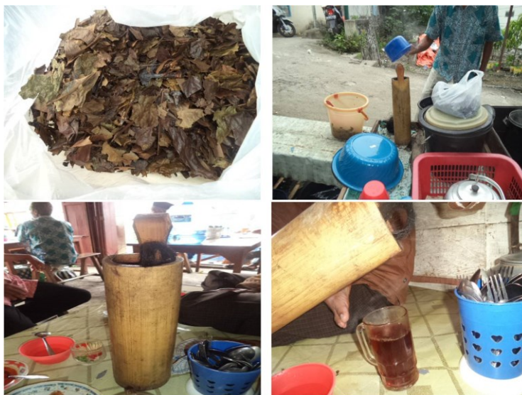
Gambar 2. Proses Pembuatan Minuman Kahwa Daun dengan Penyeduhan

Proses pembuatan minuman kahwa daun yang paling banyak dilakukan adalah dengan cara memasak air dan daun kopi secara bersamaan sampai mendidih dengan lamanya waktu pemasakan di setiap kedai/kafe bervariasi mulai dari 15-30 menit. Cara ini merata dilakukan di ketiga kabupaten. Menurut para peracik minuman kahwa daun, cara ini menghasilkan minuman kahwa daun dengan aroma dan rasa yang nikmat menyerupai kopi dengan warna air seduhan lebih pekat dari air teh.